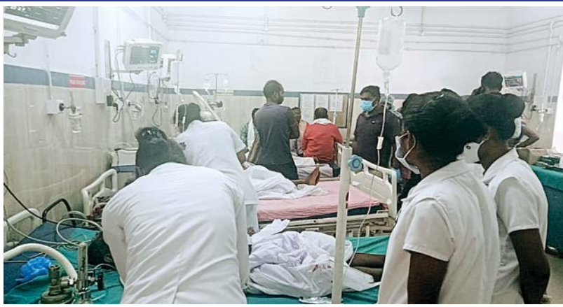
दौरान हवन का धूआं उपर जाते ही मधुमक्खियों ने लोगों पर हमला कर दिया। अचानक हुए इस

जशपुर। दीपू बगीचा में चल रहे सरहुल महोत्सव में मधुमक्खियों ने हमला कर दिया। इस दौरान मौके पर अफरातफरी मच गई। मधुमक्खियों के इस हमले में 50 से ज्यादा लोग घायल बताए जा रहे हैं। इस घटना के बाद घायलों को आनन-फानन में जशपुर जिला अस्पताल में भर्ती कराया गया जहां उनका उपचार जारी है। बता दें कि इस कार्यक्रम में शामिल होने के लिए सीएम विष्णु देव साय आने वाले थे, लेकिन इस घटना की वजह से अब सरहुल महोत्सव के कार्यक्रम स्थल को कल्याण आश्रम परिसर में शिफ्ट कर दिया गया है। जानकारी के मुताबिक, यह घटना उस वक्त हुई जब गांव के बैगा ने पेड़ों की पूजा के लिए हवन कर के विधिवत पूजा अर्चना शुरू की, इस