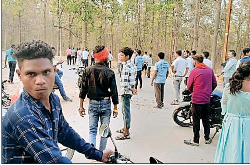
सकें। धरमजयगढ़ रेंज अंतर्गत मुख्य मार्ग 368 कक्ष क्रमांक जंगल में क्रोन्था निवासी दो बाईक सवार बड़ी मुश्किल से जान बचाकर जंगल से निकले हैं उनका कहना है, क्रोन्था चौक में मौजूद

रायगढ़। वनमंडल धरमजयगढ़ रेंज अंतर्गत सरिया नाला के ऊपर मुख्यमार्ग किनारे गुरुवार की शाम करीब 5 बजे हाथियों की हलचल से मुख्य मार्ग बंद सा हो गया सड़क के दोनों छोर में जाम की स्थिति बन गई। मिली जानकारी के मुताबिक गुरुवार की शाम करीब 5 बजे उस वक्त मुख्यमार्ग सरियानाला के ऊपर 368 कक्ष क्रमांक के जंगल किनारे सड़क में भागमभाग की स्थिति देखी गई उसी बीच दो बाईक सवार अपनी मोटरसाइकल उसी जंगल के अंदर छोड़कर जैसे जैसे जान बचाकर भागने में कामयाब हो गए। जब इस बात की जानकारी लोगों को हुई तो माहौल और गड़बड़ गया और लोग डरने लगे इसी बीच सूचना पर मौके पर पहुंची वन अमला की टीम व हाथी मित्रदल और संबंधित चौकीदार सड़क में तैनात गए होकर और लोगों को समझाइस देने लगे। ताकि हाथी से किसी भी तरह की अप्रिय घटना घटित न हो और लोग सुरक्षित मार्ग से आवाजाही कर