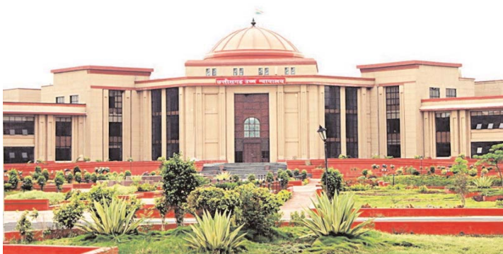
रायपुर में एडीजे दशम के रूप में सात सीनियर सिविल जजों को एंटी लेवल डिस्ट्रिक्ट जज के रूप में पदोन्नत किया गया है। इसके साथ ही