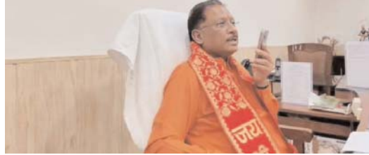
बाद भी मिलता रहेगा।

मुख्यमंत्री को इसी बातचीत के दौरान बस्तर की महिला से पता चला कि कांग्रेसी कार्यकर्ता महतारी वंदन योजना को लेकर भ्रम फैला रहे हैं कि यह योजना लोकसभा चुनाव के बाद बंद हो जाएगी। मुख्यमंत्री को मिला यह फीडबैक उनकी चुनावी सभा में भाषण का अंश बन गया। उन्होंने कोरबा कि सभा में इस पर कहा कि जब तक उनकी सरकार रहेगी तब तक महतारी वंदन योजना बंद नहीं होगी। उन्होंने फोन पर भी महिलाओं को आश्वासन दिया कि अगली बार भी उनकी सरकार बनाइये, योजना का लाभ उसके