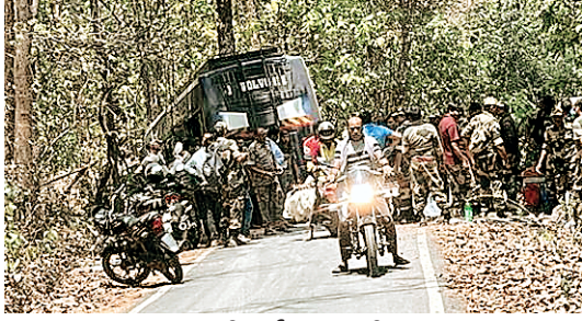
बड़ी दुर्घटना टली

बताया यह भी जा रहा है कि जिस जगह हादसा हुआ है वहां पर दाहिने तारीफ घाटी थी अगर बस घाटी से नीचे गिरती तो बहुत बड़ा हादसा हो सकता था परंतु बस चालक के द्वारा सूझबुझ का परिचय देते हुए बायं तरफ बस को मोड़ दिया गया।